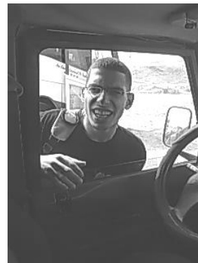
• טיול "טרומ"גיוס של שיעור ב'